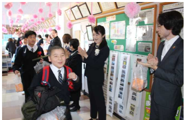
在校生や先生方でお見送りしました。