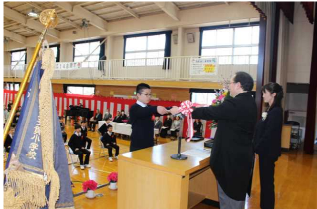
立派な姿で卒業証書を受け取りました。

19名の卒業生が希望に胸をふくらませ、思い出深い多賀小学校を巣立っていきました。卒業生は「門出の詩」で、「仲間との出会い」や「全校のみんなと過ごした大切な日々」、「家族や地域の方、先生方への感謝」、「中学校生活の夢や希望」などを気持ちを込めながら述べていました。おかげをもちまして、今年度も、厳粛かつ盛大な卒業証書授与式を行うことができたことをたいへんうれしく思います。保護者の皆様、ご来賓の皆様、ご出席いただきありがとうございました。