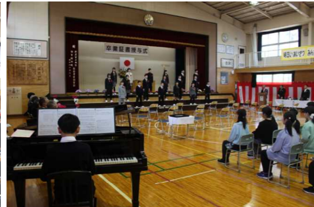
卒業生の歌は卒業生がピアノ伴奏をしました。