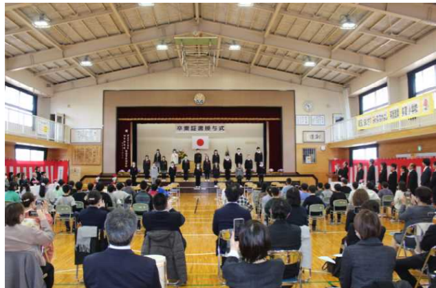
感動的な「門出の詩」でした。