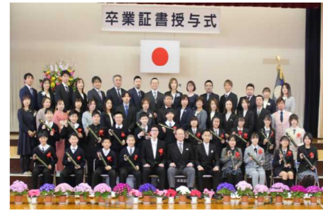
保護者の方と一緒に記念撮影をしました。